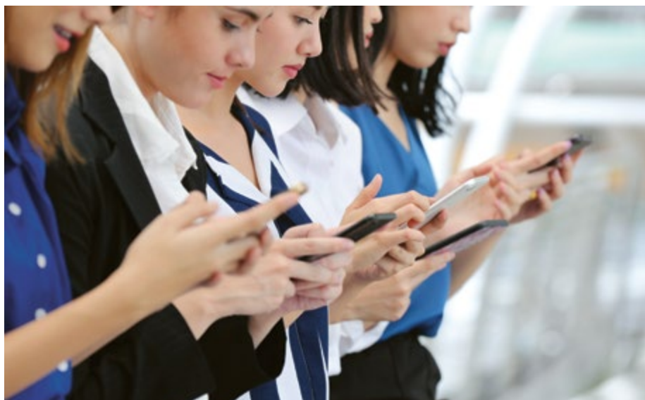
Des jeunes gens organisent leur vie par le portable.

L'engagement pour plus de présence sur Internet a aussi contribué à ce que le nombre des demandes d'aide auprès de la centrale d'urgence continue d'augmenter: +4 % en 2018, +17 % depuis début 2017.